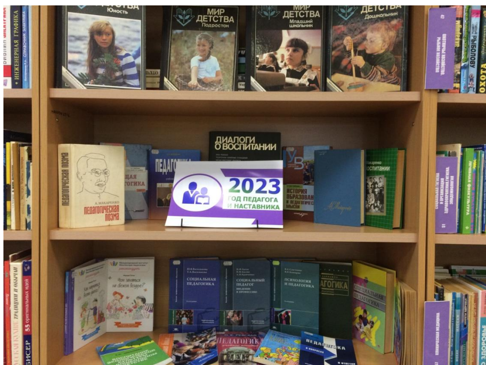
Выставка «2023 – Год педагога и наставника»

В рамках Года педагога и наставника в библиотеке состоялись: